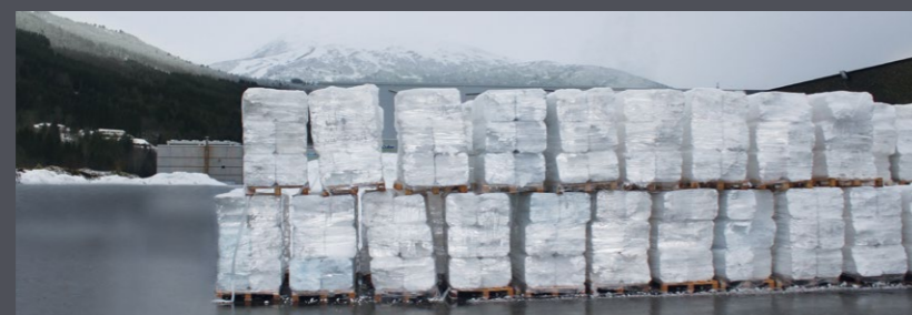
EPS-Blöcke auf Paletten in Norwegen