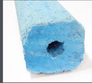
Block aus XPS-Dämmplatten