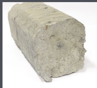
Block aus PUR-Hartschaum