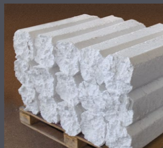
EPS Blöcke auf Palette