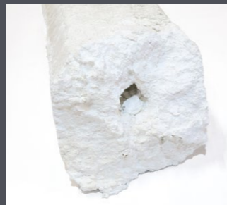
Block aus EPS