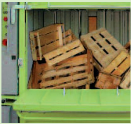
Selbst Holzkisten und Ähnliches sind für die DIXI 50 S kein Problem