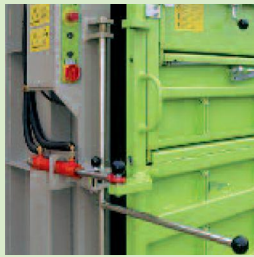
Der hydraulische Türöffner (Option)