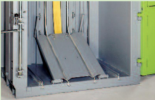
Leicht zu bedienen: Der Auswerfer