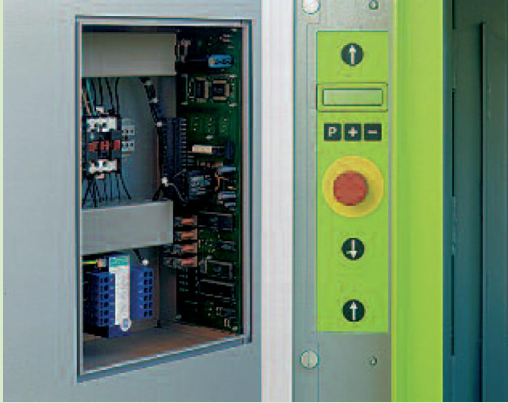
Wartungsarm: Die Microprozessorstuerung