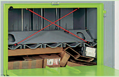
Robust: Der beidseitig geführte Pressstempel